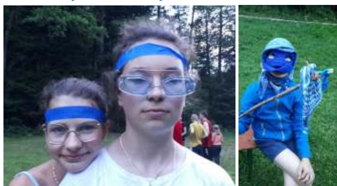
Vybíjená červení versus modří...