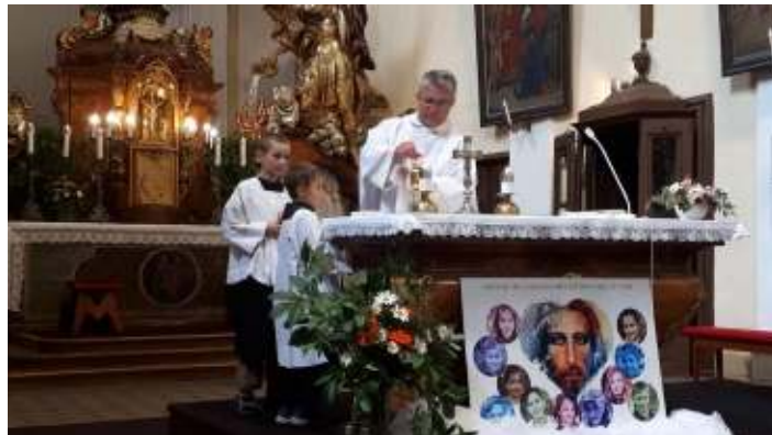
Závěrečný nástup a mše sv. v Nových Hradech.