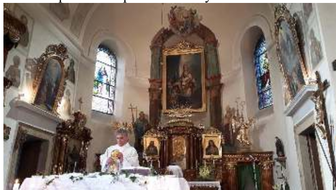
Mše sv. v kostele sv. Mikuláše v Dolní Dobrouči.