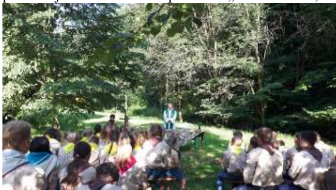
Mše sv. pro skauty z Dolní Dobrouče.

Postupně jsme začali realizovat nový úkol, který je spojený s nepříjemným stěhováním a dalšími nejistotami. Budeme podobně jako Petr a ostatní apoštolové „zažívat bouři“, která nás ale přivede k upevnění důvěry k Bohu.