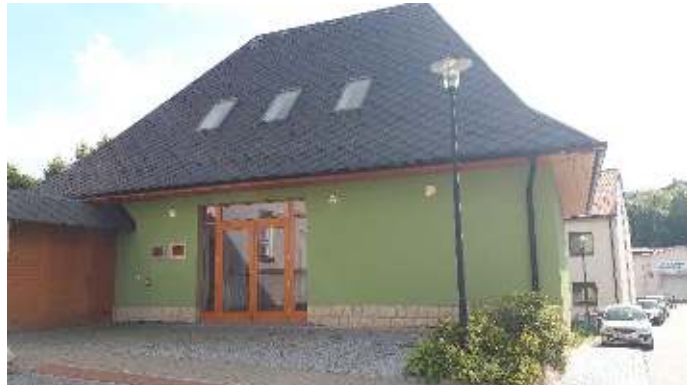
D- centrum v Dolní Dobrouči.