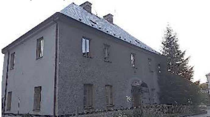
Fara v Dolní Dobrouči.